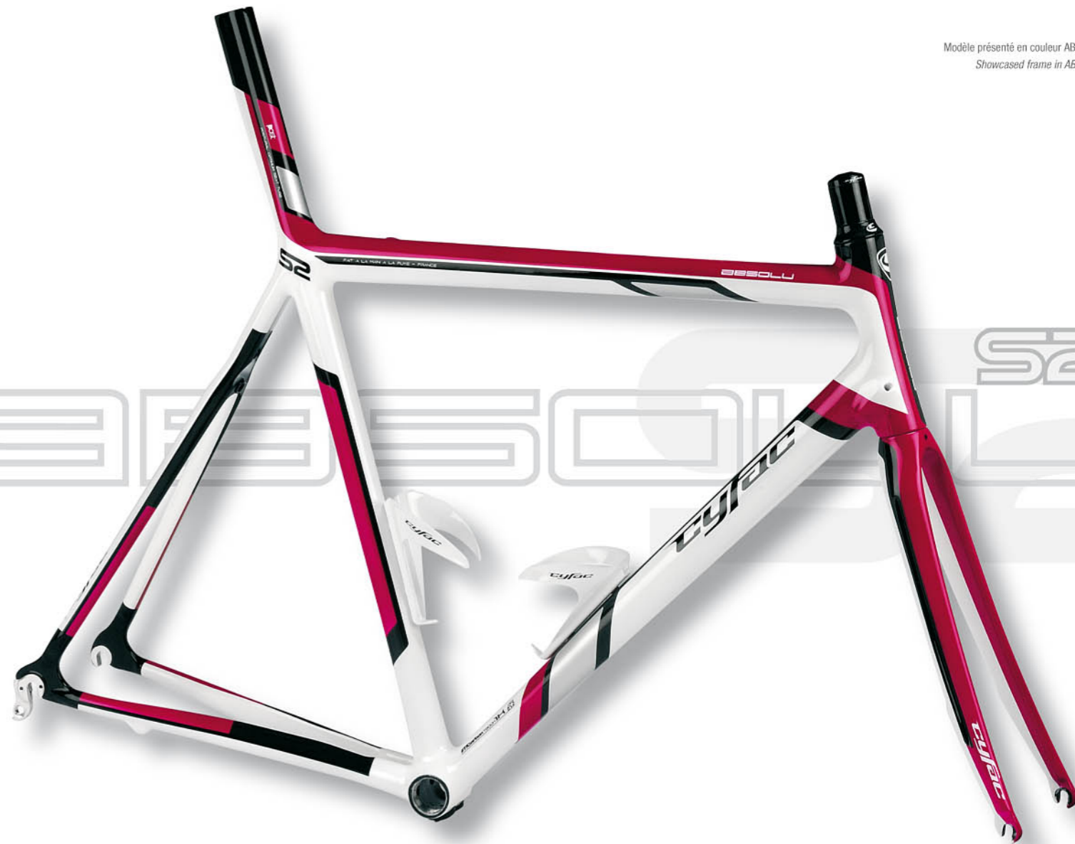
Modèle présenté en couleur ABSOLU S2 N°1. Showcased frame in ABSOLU S2 N°1.